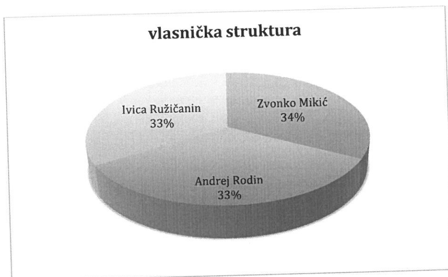
Vlasnička struktura prije i nakon mjera restrukturiranja

Tvrtka je 100% u privatnom vlasništvu, a vlasnici tvrtke i jedini osnivači jesu Zvonko Mikić, Andrej Rodin i Ivica Ružičanin. Nakon restrukturiranja vlasnička struktura tvrtke neće se mijenjati. U nastavku se nalazi grafički prikaz vlasničke strukture prije i nakon mjera restrukturiranja.